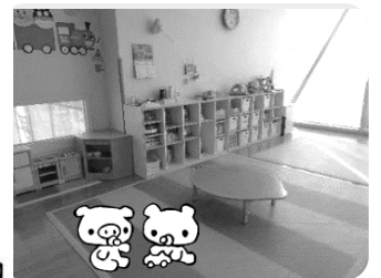
のびすく仙台託児室

のびすく宮城野 仙台市宮城野区五輪2丁目12-70 原町児童館内 TEL:022-352-9813 FAX:022-352-9812