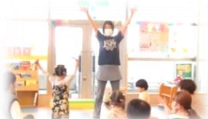
親子ボックスも大盛り上がり!

4月28日(金)～30日(日)の3日間、タンタカ誕生祭を開催しました。たくさんの親子のみなさんや、地域のボランティアさん、支援団体の方々が来てくださり、いつものひろばがお祭りの雰囲気いっぱいになりました! ゲストによる歌や楽器演奏、親子あそび。お子さんの手形がとれるカード作りなどののびすくへのお祝いメッセージもたくさん寄せられ、このコーナーも大盛況でした。これからも皆さんと一緒に良いのびすく泉中央を作っていきたいと思っております。