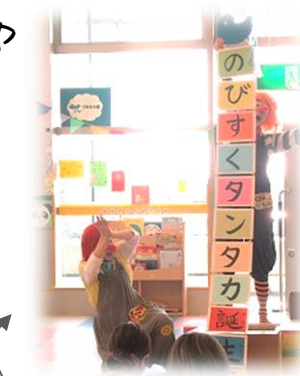
クラウンユニット「くみとヤッコ」さんによるオープニング♪