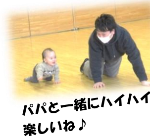
パパと一緒にハイハイ 楽しいね♪