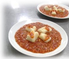
ジャガイモなどを使って 「ニョッキ」を作りました!