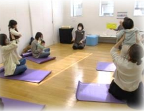
劇団ふたりの おはなし会でした☆