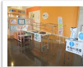
「受付入口の様子です。手指の消毒や検温のお願いをしています」

リピーターの方も多のですが、初来館の0才児のママや引っ越してきたばかりで、やっと外に出て来られた親子などはじめましての方もたくさん遊びに来られています。ママやパパもちょっと一息ついたり、気分転換にひろばに遊びにきませんか(^-^)?