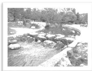
「小川も流れています♪」

のびすく泉中央から歩いてすぐのところにある七北田公園は、芝生広場、遊具広場、噴水池、水の階段などがあるととても広い公園です。