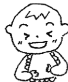
「じょうずじょうず」

何かできた時は手を打ちながら褒めてあげましょう。赤ちゃんも人を褒めるときに使うようになります。心の安定や意欲にもつながるそうです。