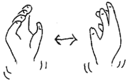
てんこてんこてんこ♪

8/23(金)「わらべうたであそぼう」で教えていただいた、わらべうたをいくつか紹介します♪ぜひ、お家でもやってみてくださいね!