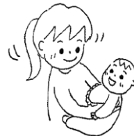
かんぶかんぶかんぶ♪

正面から顔を見て、顔の横で手を動かしたり、顔を振ってみたり、目線を合わせ楽しそうにうたいかけてみましょう。少しずつ親の動作を真似するようになり、やりとりを楽しんだりします。