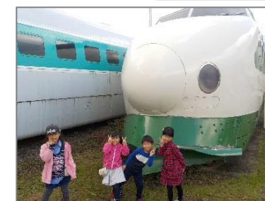
子どもたちの感想 「めっちゃ！楽しかった～！」