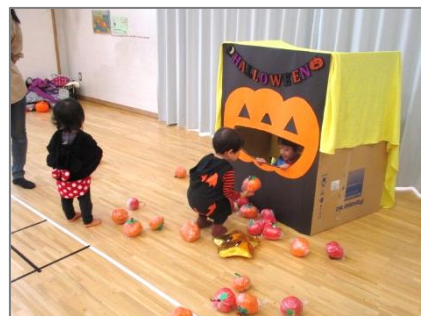
かぼちゃの口に何があるかな～？ のそく姿がかわいいです！