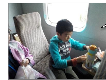
新幹線の中でお弁当食べたよ！