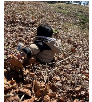
落ち葉の感触を楽しんでいるのかな。気持ちいいね♪