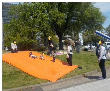
登って降りて、不思議な感覚！皆歩くのに夢中のように。